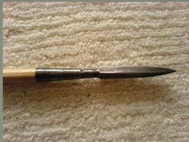
Наконечник стрелы типа бодкин