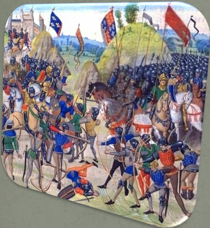
Битва при Креси, миниатюра из "Хроник" Жана Фруассара

Битва при Креси произошла 26 августа 1346 года у местечка Креси в Северной Франции, став одним из важнейших сражений Столетней войны. Сочетание новых видов оружия и тактики, применённых англичанами в битве, привело многих историков к выводу о том, что битва при Креси стала началом конца рыцарства.