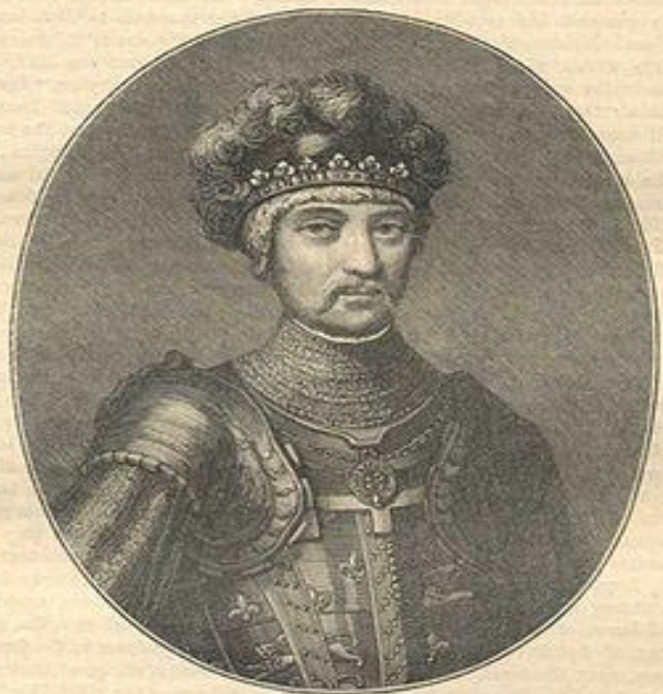
EDWARD THE BLACK PRINCE.

Эдуард «Черный принц». «Черным принцем» его назвали за его Черные доспехи.