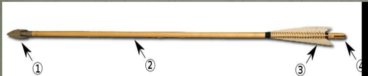
Средневековая стрела: 1 — наконечник; 2 — древко; 3 — гусиное оперенье; 4 — выемка для тетивы