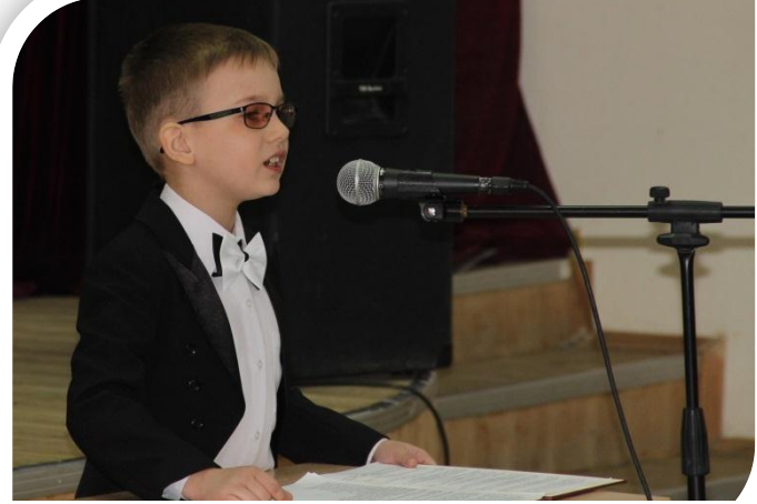
Проект «Почитатель души забытых уголков»