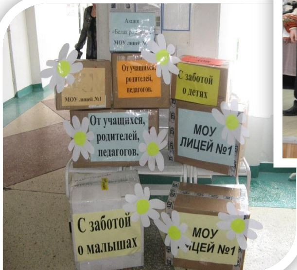
Акция «Книга малышу»