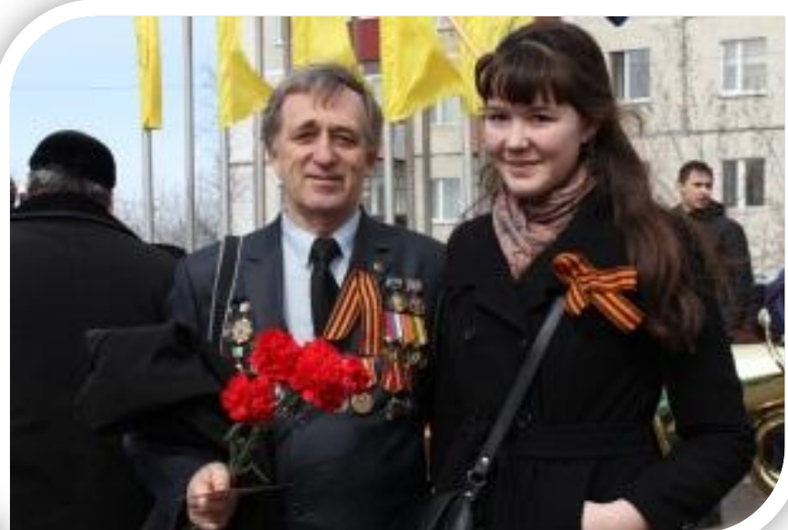
Акция «От сердца к сердцу»