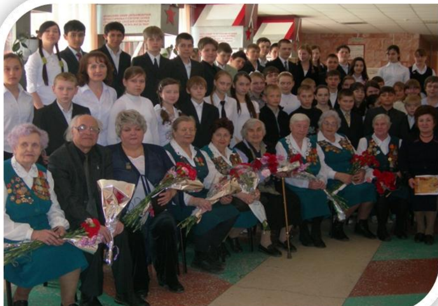
Встреча с клубом «Фронтовые подруги»