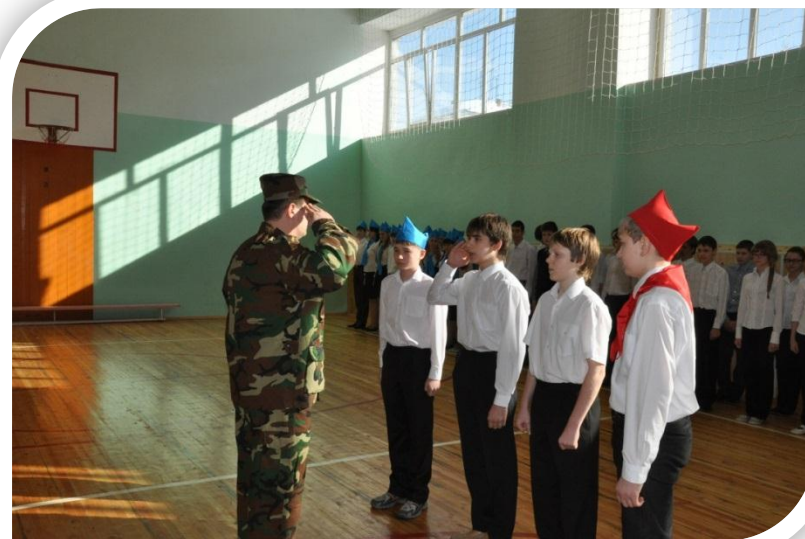
Конкурс - смотр песни и строя