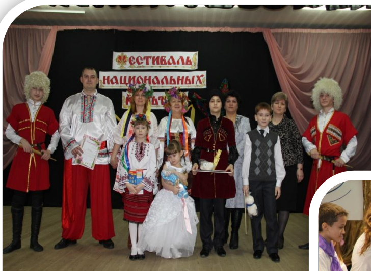
Фестиваль национальных культур