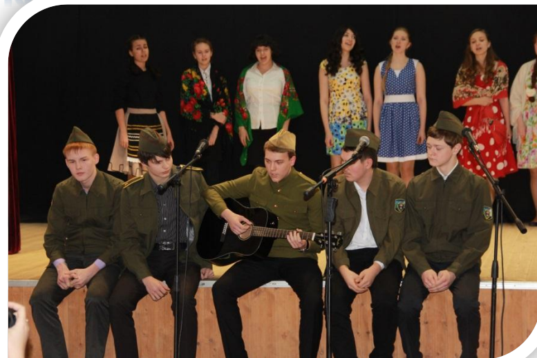
Фестиваль «Песни военных лет»