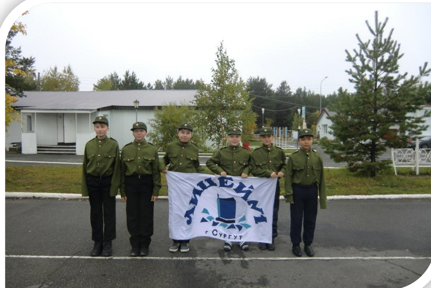
Военно-спортивная игра «Зарница»