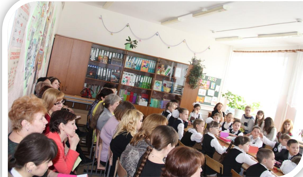
Проект «Моя родословная»