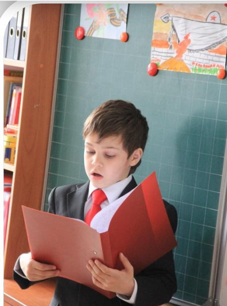
Проект «Мой прадедушка - солдат»