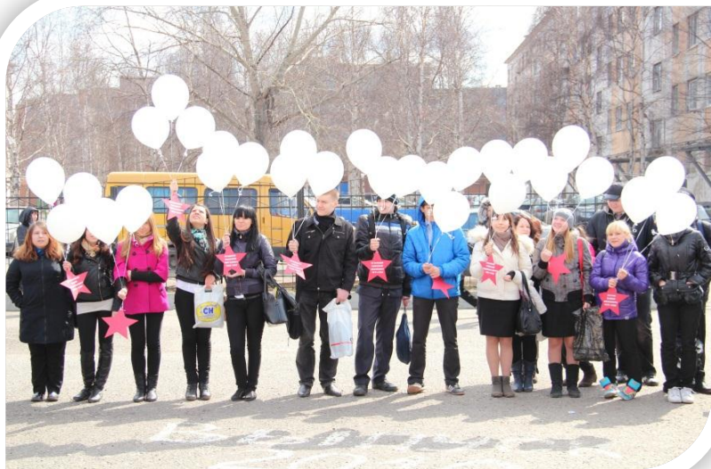
Акция «Звезда Памяти»