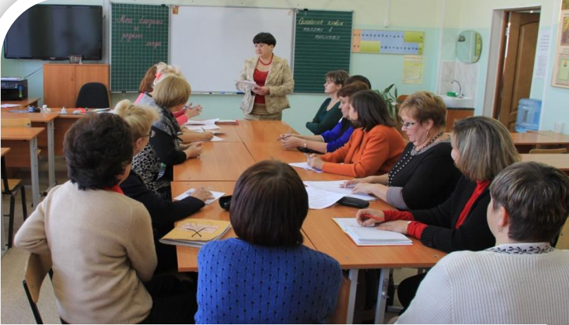
Ресурсный круг «Родной очаг»