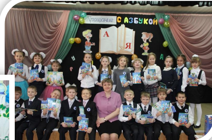
Праздник «Прощание с Азбукой»