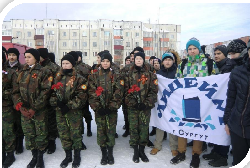
Митинг у мемориала Славы