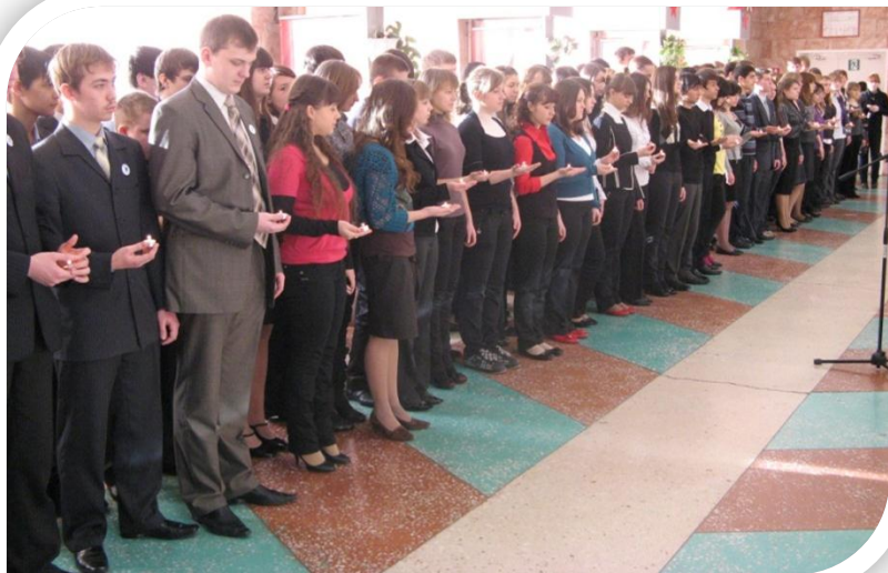
Митинг «Поминальная свеча»