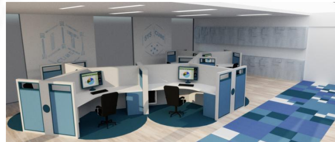
Создание центров цифрового образования для детей «IT-куб»