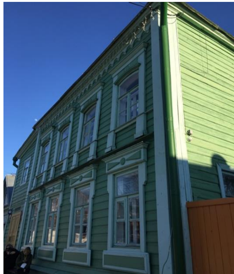
Дом- музей семьи И.Н. Ульянова