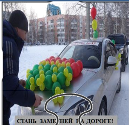
СТАНЬ ЗАМЕ НЕЙ НА ДОРОГЕ!