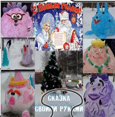
СКАЗКА СВОИМИ РУКАМИ