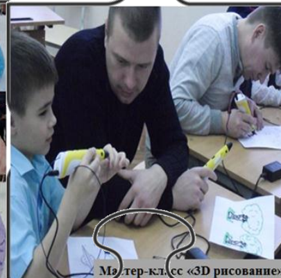
Мастер-класс «3D рисование»