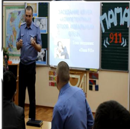
Историко – патриотический проект «Подвиг народа бессмертен»