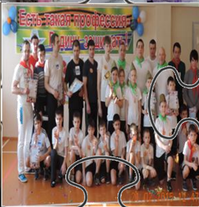
Аллея «Папино дерево»