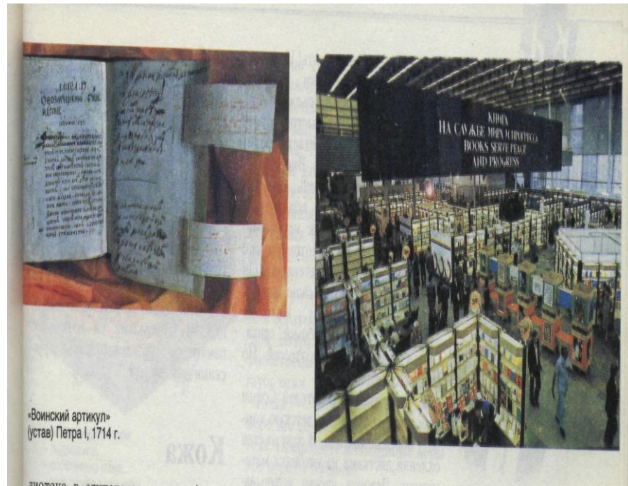
«Воинский артикул» (устава) Петра I, 1714 г.