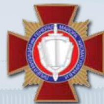
Почётный знак «Лицей милиции имени генерал-майора Хисматулина В.И.»