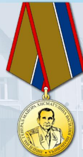
Памятная медаль «Лицей имени генерал-майора Хисматулина В.И.»