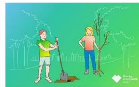
Мой дом – моя Земля