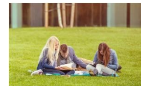
Яркие книги для подростков за 2023 год: 5 переводных историй