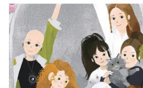
Книжная подборка самых ярких дебютов для детей и подростков за 2023 год Юные герои и большие вопросы: яркие дебютные повести для детей и подростков за 2023 год