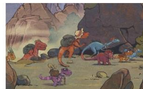
Ларс Мале. Друзья-динозаврики Приключения Юрского периода