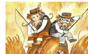
Разноцветные поэтические истории Несколько книг из серии «Радуга-дуга»