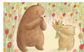
Сила и сочувствие: 8 современных книг к 8 марта

Музыка и стихия: отрывок из книги Сюзии Ли «Лето»