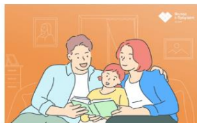
Вместе – дружная семья!