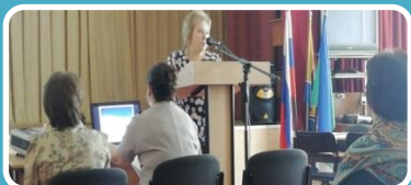
МБОУ СОШ № 20