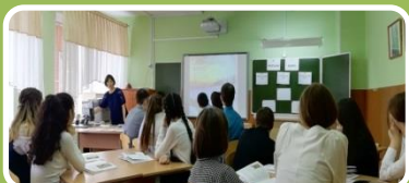
МБОУ СШ № 12