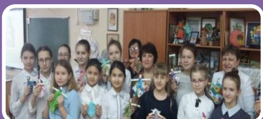
МБОУ СОШ № 15