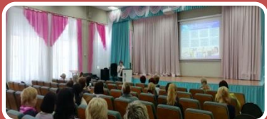
МБОУ НШ «Перспектива»