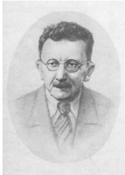
В.Н. Сорока- Росинский