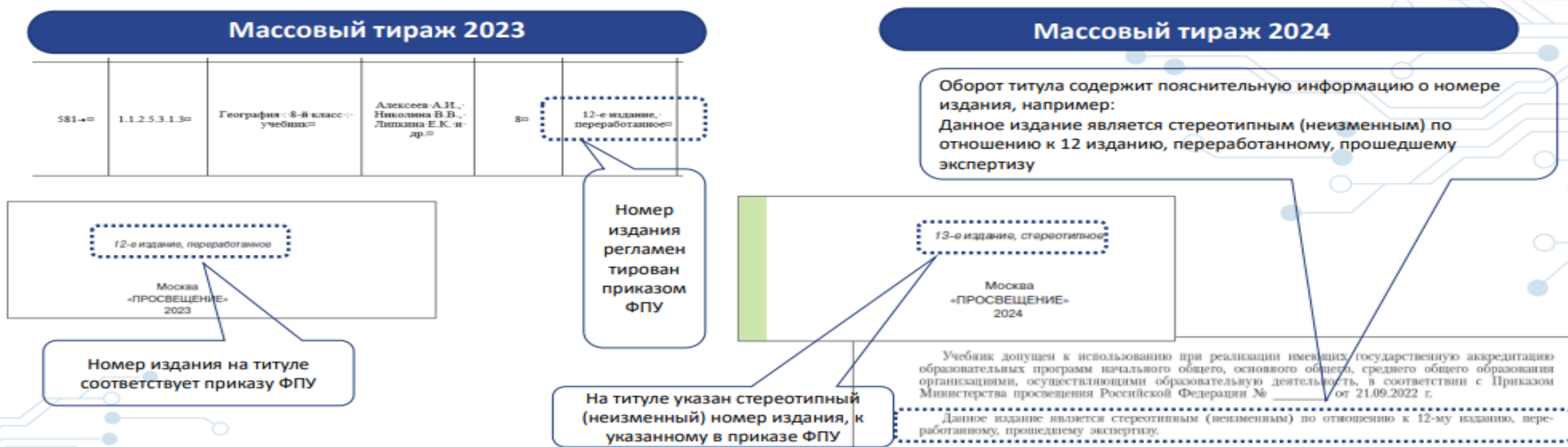
Рис. 1. Оформление титула и оборота титула переработанных учебников под ФГОС 2021

В действующих ФПУ указывается номер издания регламентированный приказом, например 12-е издание переработанное, последующее издание учебника будет обозначаться как 13-е издание, стереотипное (см. рис. 1).