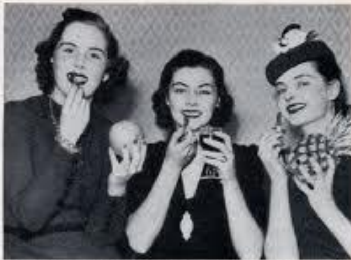
These young women are testing lipstick in assorted fruit and beverage flavors

Lipstick, like gum and soda pop, can now be obtained in a choice of flavors to suit the taste of the user. The stick-form lip rouge is made in a wide variety of fruit and beverage flavors, including peach, apricot, rose, champagne, banana, and pineapple. The three young women at the right are making a taste test of orange, wine, and pineapple lipstick.