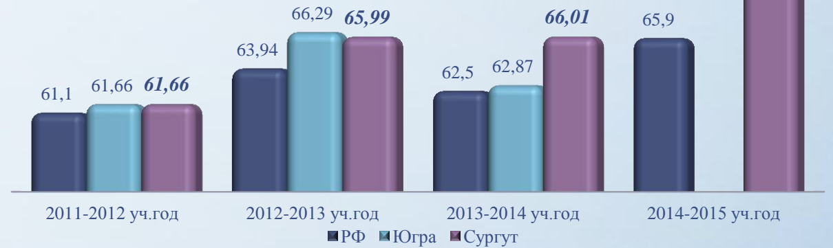
Динамика тестового балла по русскому языку по годам обучения