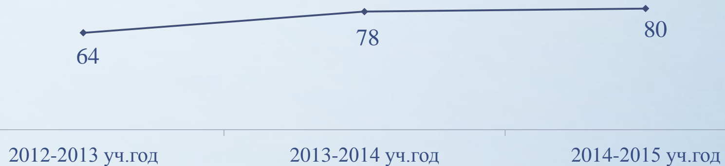
Динамика тестового балла по русскому языку по результатам МДР