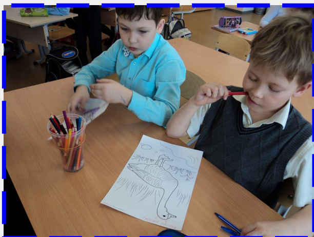
Больше всего студийцы любят рисовать и раскрашивать, а нужно еще и рассказы придумывать