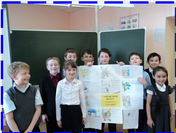
Создавать спецвыпуск живой газеты «Здравствуй, весна!» - дело увлекательное.

На уроках детской медиастудии ребят ждали новые открытия, увлекательные путешествия и конкурсы, коллективные творческие дела. Они узнали, как преобразается природа весной, где зимует еж, как выглядит дятел и откуда прилетает скворец. Сами придумывали увлекательные истории на экологическую тему и создавали живую газету и даже мультипликационный фильм.