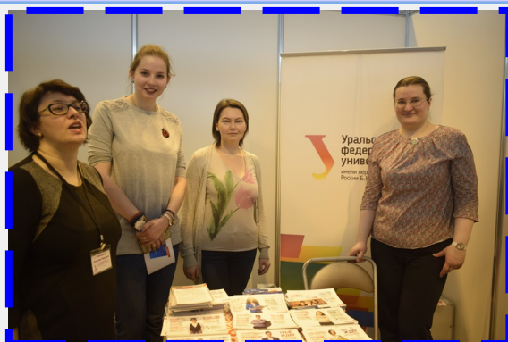
Участник выставки – Уральский федеральный университет имени первого Президента России Б.Н. Ельцина. Традиционное естественно-научное образование дополнят в этом году обучение по специальностям «Медицинская биофизика», «Медицинская биохимия».