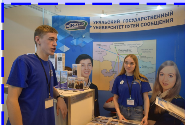
Учеников 10 А класса МБОУ СОШ № 27 привлекают актуальные профессии в сфере экономики, маркетинга. Их интересует не только стоимость обучения и количество бюджетных мест, но техническая оснащенность вуза, возможности прохождения практики.