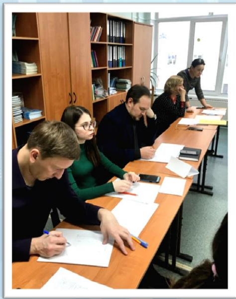
Эксперты ведут подсчеты баллов.