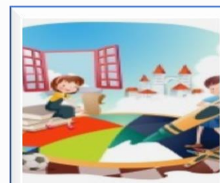
Современный детский сад