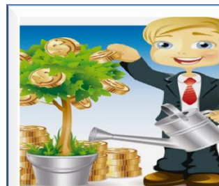
Финансовая грамотность – вклад в надежное будущее