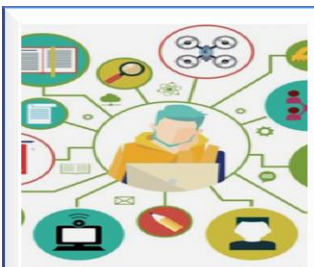
Я – архитектор будущего