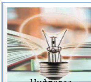
Цифровое образование: инвестиции в будущее