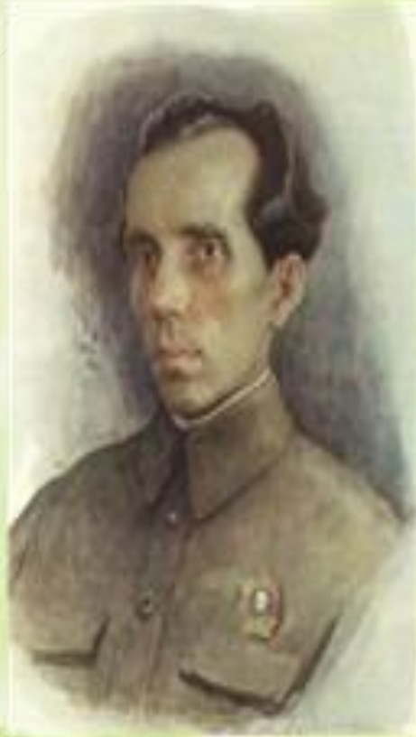
Н. А. Островский