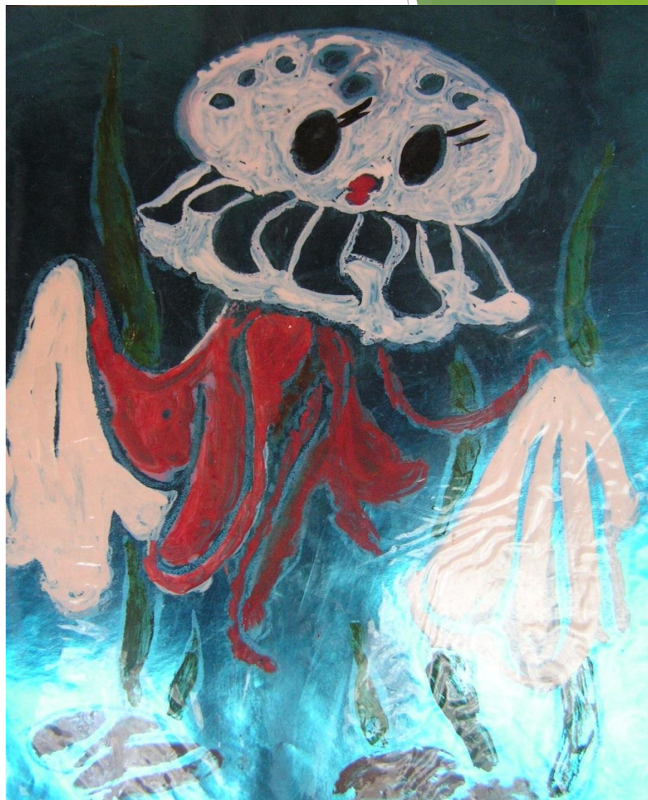
Рисунок наносится гуашью с добавлением клея ПВА. Цвет фольги подбираем по замыслу: голубую, синюю, фиолетовую, зеленую и т.д. Для изображения подводного животного, необходимо сделать рисунок, а потом “передавить” его на фольгу и разукрасить