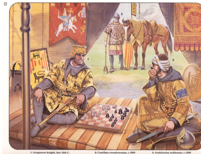
1: Aragonese knight, late 13th C. 2: Castilian crossbowman, c.1390 3: Andalusian nobleman, c.1290

Фехтование Плавание Соколиная охота Сложение стихов в честь дамы сердца Владение копьем Верховая езда Игра в шахматы .