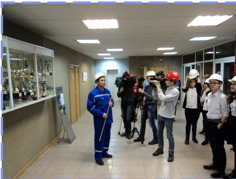
17 октября состоялась экскурсия для старшеклассников на Сургутскую ТРЭС-1.

В музее предприятия юные гости познакомились с основными этапами производства тепловой и электрической энергии. Их провели в машинный зал – самое сердце энергетической системы. Познакомились с основным оборудованием станции. Ребята посетили блочный щит управления, откуда и происходит оперативное управление энергоблоками. Экскурсия очень впечатлила ребят, ведь они прикоснулись к такой мощной энергосистеме Тюменской области, как ТРЭС-1, которая является одним из лидеров по выработке электроэнергии среди тепловых электростанций РФ.