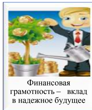
Финансовая грамотность – вклад в надежное будущее