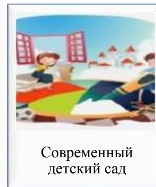
Современный детский сад