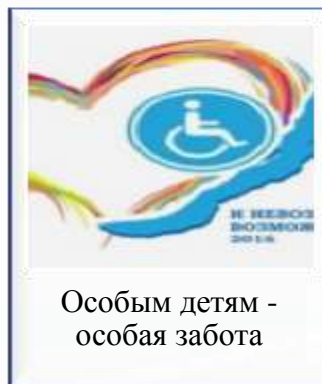
Особым детям - особая забота