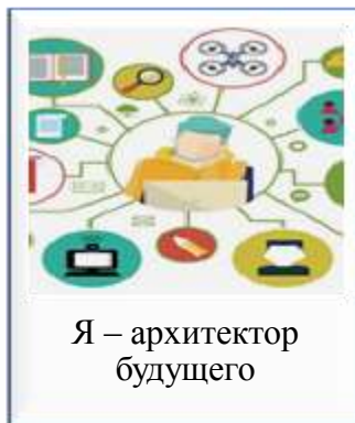
Я – архитектор будущего