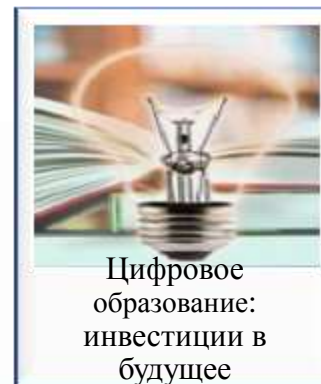
Цифровое образование: инвестиции в будущее