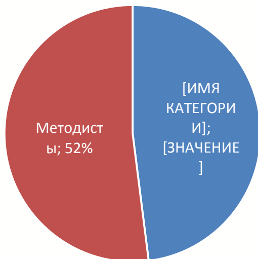
Состав методического объединения с точки зрения занимаемой должности