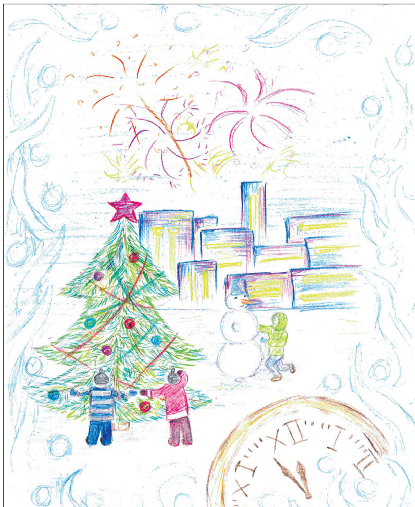
Иллюстрация к стихотворению Леонида Гайкевича «Изменчива погода в декабре». Марина Мухаметханова, бг.