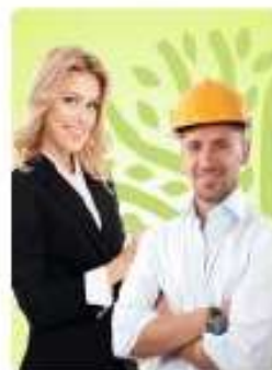
Сотрудник организации-партнера Экодиктанта

Категории отличаются по сложности вопросов: от низкой (для подростков 12-17 лет) до высокой (для экспертов, студентов, специалистов, руководителей в экологической сфере).