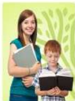
Подростки 12-17 лет