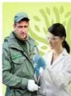
Эксперт, студент, специалист, руководитель в экологической сфере