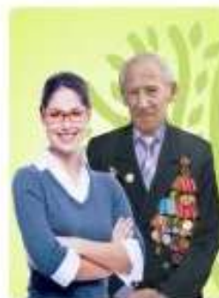
Без профильного образования возраст старше 18 лет